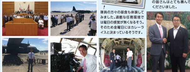
愛知県議会議事堂を見学

日頃は見られない貴重な見学と、お忙しい中でお時間をさいてくれた大村知事との談話に、参加者の皆さんはとても喜んでくださいました。