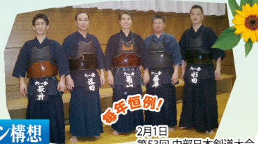
常任恒例! 2月1日 第53回 中部日本剣道大会

書籍等の貸し出しが多く、足りない状況で、今後は書籍(CD&DVD)の購入に力を入れ、また 休館日が月曜日ではなく水曜日 ということを知り徹底しなければならぬとのことです。皆さんも気をつけて下さいね。 また個人的には飲食店の利用状況がとても気になります。最後に、ともに成長していく施設にしたい、という館長の熱意が印象に残りました。