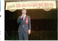
2009 日本芸能祭 inチャリティー