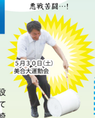
悪戦苦闘...! 5月30日(土) 美合大運動会

・横浜市 横浜こども科学館 ・千代田区 科学技術館 ・台東区 国立科学博物館 以上について調査研究視察をしました。 本市においても「こども科学館」の建設を構想中です。いわゆる「箱モノ」については、今以上に十分な議論が必要で、岡崎市という地域の特色を考えて、この施設で何をやりたいのかははっきりとして、市民の皆さんに理解を得ることが必要です。