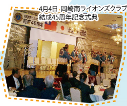
4月4日、岡崎南ライオンズクラブ 結成45周年記念式典