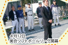
4月12日 美合ソフトボールリーグ開幕

岡崎市都市計画マスタープランの地域別説明会が、各地域で順次開催中です。本市の都市計画に関する基本方針を定めるもので、平成32年を目標年次としています。 具体的には土地利用や道路・公園・下水の整備などをどのように整備していくかを示すものです。 本日は大平支所管内の説明会がありました。 拠点づくりの課題は、美合駅周辺の商業等都市機能の強化や、交通結節機能の強化が必要で、計画の内容は、美合駅周辺整備(駅前広場・駐車場の整備)、乙川の改修(遊水地の整備促進)、住宅系市街地の形成などです。