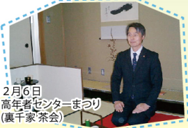
2月6日 高年者センターまつり(裏千家茶会)

本市も一般家庭、学校給食センター、病院や飲食事業所から排出される生ゴミ、また額田地区からの間伐材、樹皮を利用するバイオマスなどの可能性があります。技術的な問題よりも私たち一人ひとりの環境に対する意識が問題です。その地域に合ったスタイルのバイオマスを考えたいと思います。